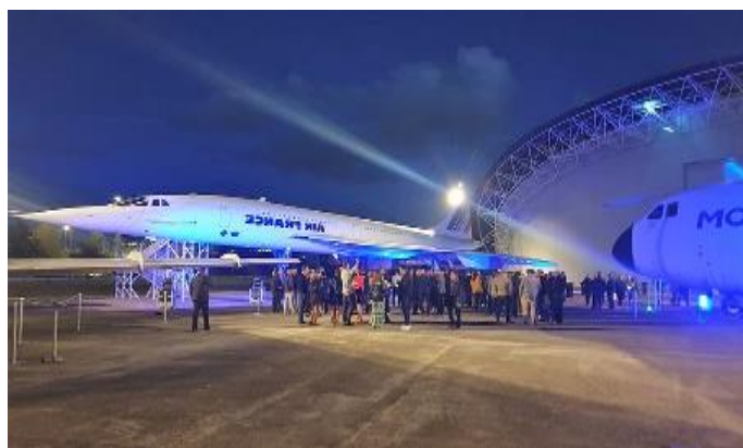
Le Musée de l'aviation, Aéroscopia

Please visit the event website or access directly through http://globalmeetings.airfranceklm.com/Search/promoDefault.aspx?vendor=AFR&promocode=39005AF