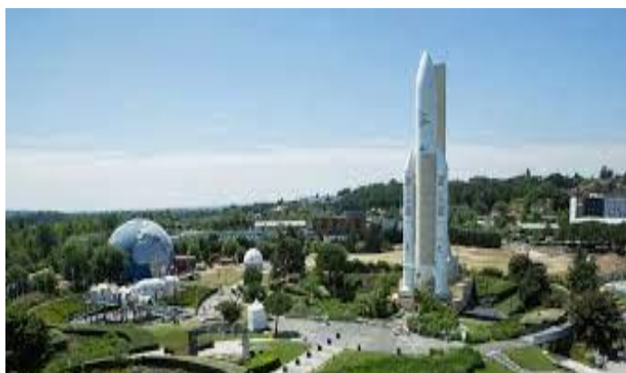
La Cité de l'Espace