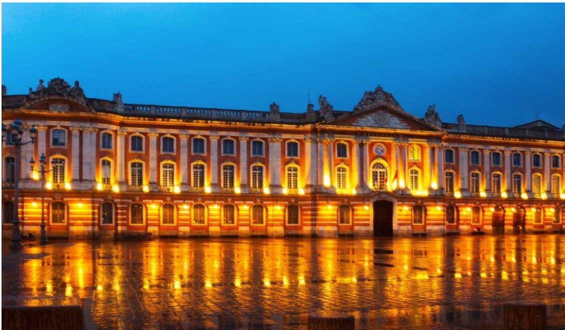
La place du Capitole

FARA Fédération Associations Régionales Allocataires de la C. A. R. M. F.