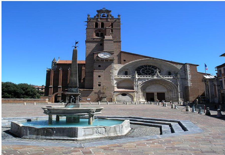
La place St Etienne